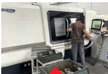
持续投资 机加工设备

1000 m 2 的机加工车间, 1500 m 2 的装配及测试车间, 2000余平的储存区域。美嘉诺用最优的工业配套来满足市场的需求。